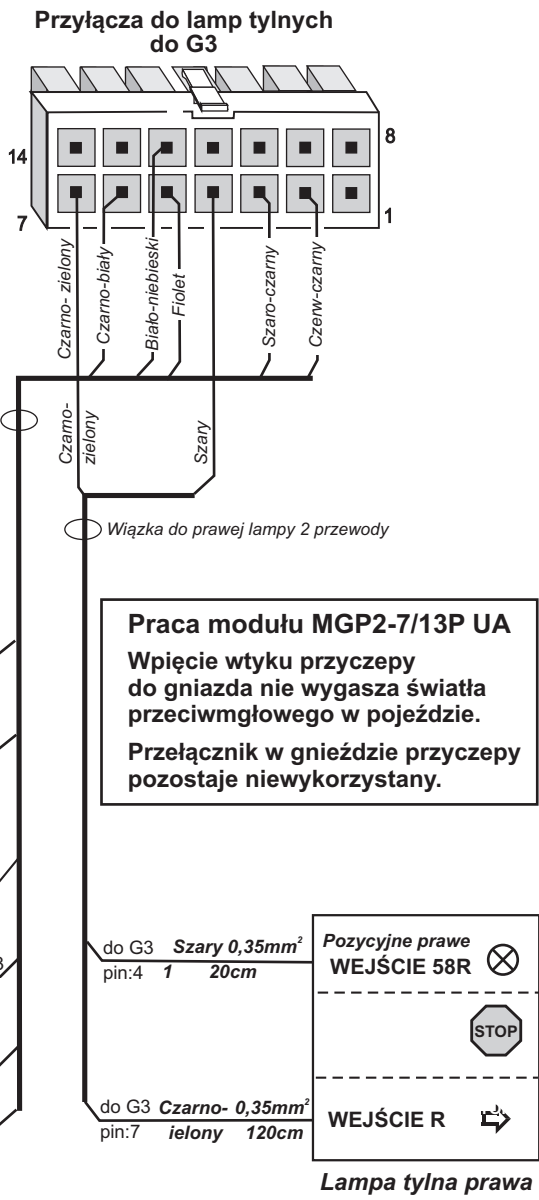
Lampa tylna prawa

Praca modułu MGP2-7/13P UA Wpięcie wtyku przyciępy do gniazda nie wygasza światła przeciwmgłowego w pojeździe. Przełącznik w gnieździe przyciępy pozostaje niewykorzystany.